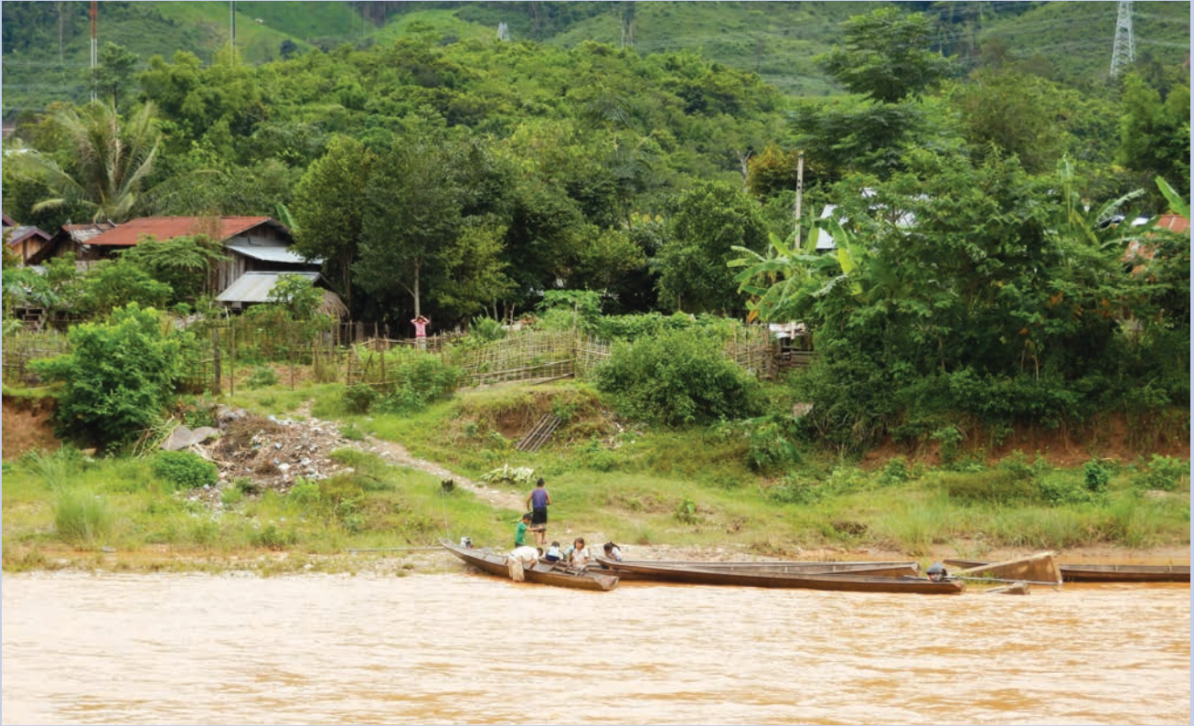
ประชาชนที่อาศัยอยู่ริมแม่น้ำเจียบต้องพึ่งพาแม่น้ำเพื่อการดำรงชีพและการขนส่ง

สถานภาพ: อนุมัติเมื่อปี 2557 การก่อสร้างยังดำเนินอยู่