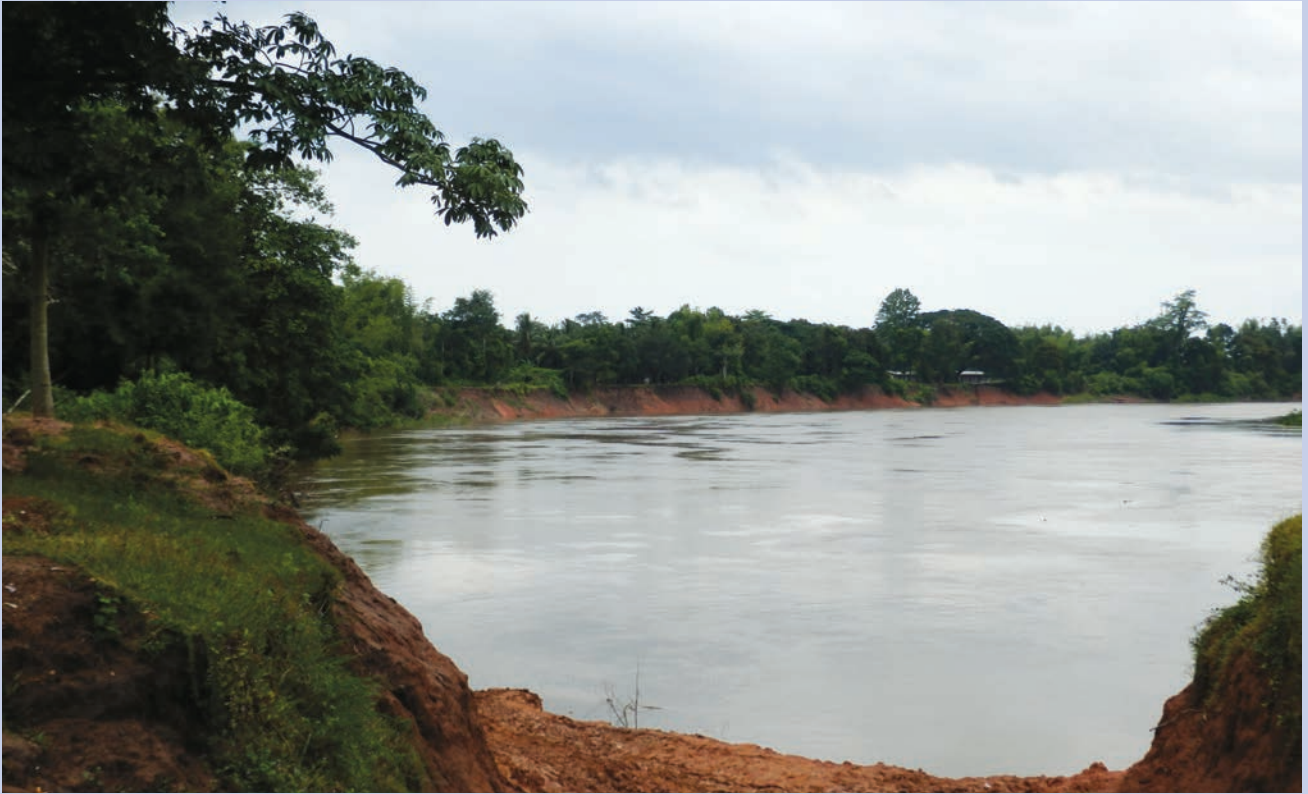
ด้านท้ายน้ำของเขื่อนน้ำเทิน 2 ตามลำน้ำเซบียงไป สภพริมฝั่งน้ำยังคงมีการกัดเซาะ: ส่งผลให้ชาวบ้านสูญเสียที่ดินที่มีค่าและเคยใช้เพาะปลูก น้ำยังคงมีลักษณะขุ่น ทำให้ยากต่อการจับปลา และสัตว์น้ำอื่นๆ ซึ่งเคยเป็นแหล่งโปรตีนที่สำคัญของชาวบ้าน

สถานภาพ: อนุมัติเมื่อปี 2548 การก่อสร้างเสร็จโดยสมบูรณ์ปี 2553