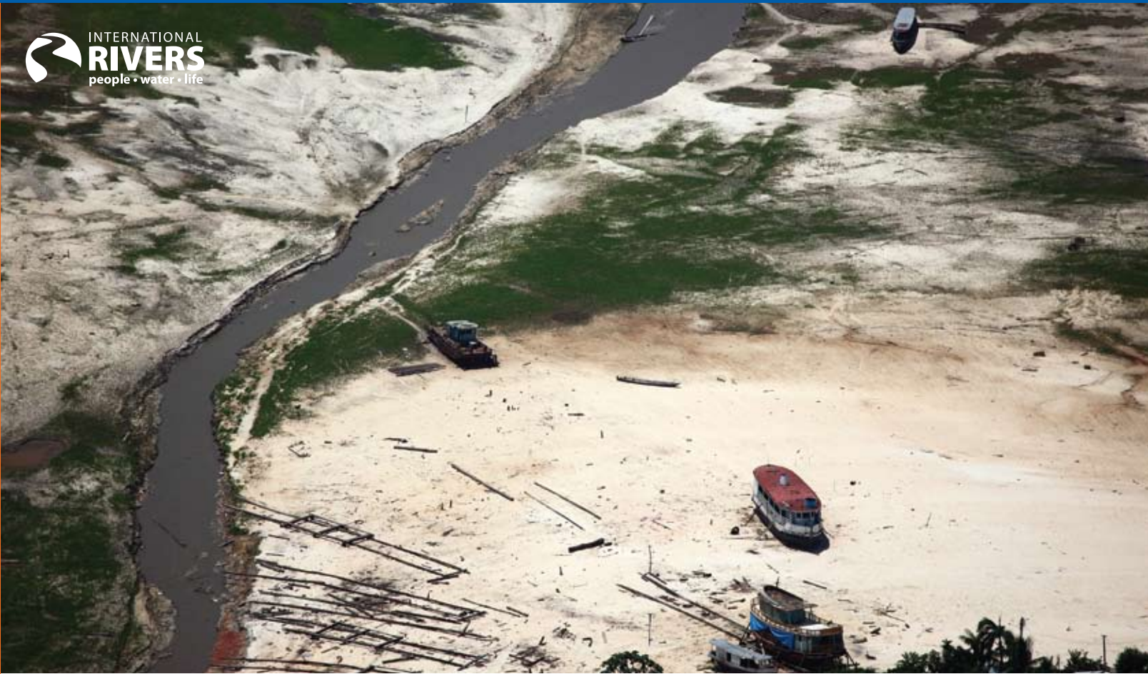
Dürre im Amazonasbecken lässt Boote – und Stauseen – auf dem Trockenen sitzen.