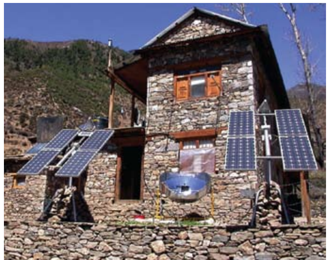
Solarenergie in einem nicht ans Stromnetz angeschlossenen Dorf in Nepal.

Das Potential Energiesysteme zu diversifizieren und zu dezentralisieren um unseren Energiebedarf zu decken ist enorm. Diversifizierung ist vor allem wichtig in ärmeren Ländern, welche momentan für ihren Strombedarf noch zu stark von Wasserkraft abhängig sind. Kleinere Projekte können in kürzerer Zeit gebaut, besser aufeinander abgestimmt, und somit besser an neue Klimabedingungen angepasst werden. Verglichen mit großen, zentralen Projekten sind sie ausserdem besser geeignet Millionen von Menschen in ländlichen Familien die an Energiearmut leiden mit Energie zu versorgen.